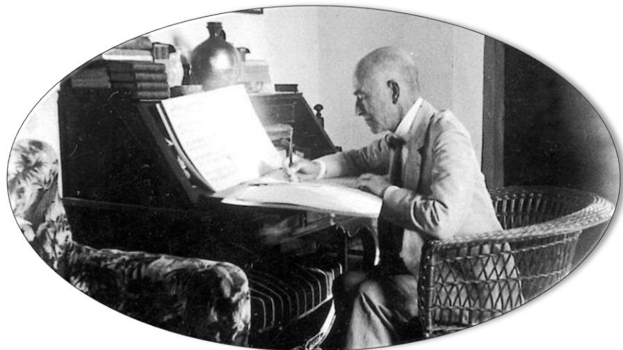
Manuel de Falla fotografiado por su amigo, el fotógrafo granadino Rogelio Robles Pozo, en el Carmen de la Antequeruela (Granada) en 1924