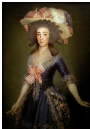
La duquesa de Osuna, María Josefa Pimentel fue una de las mecenas de Boccherini.