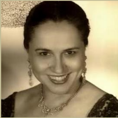
Gracia de Triana

“ En hombre, yo; en mujer, Gracia de Triana ”. Con esta frase tan rotunda sentenciaba el gran cantaor Pepe Marchena quiénes, para él, eran las dos figuras más relevantes de la época dentro del mundo del flamenco y la copla.