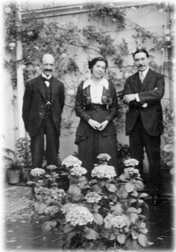
Manuel de Falla, María Lejárraga y Joaquín Turina Madrid 1916

Canción del fuego fatuo Lo mismo que er fuego fatuo, lo mismo es er quere. Se huege, y te persigue, te llamas, y echa a corre. Lo mismo que er fuego fatuo, lo mismo es er quere! Nace en las noches de agosto, cuando aprieta la calor. Va corriendo por los campos en busca de un corazón.... Lo mismo que er fuego fatuo, lo mismo es el amor!