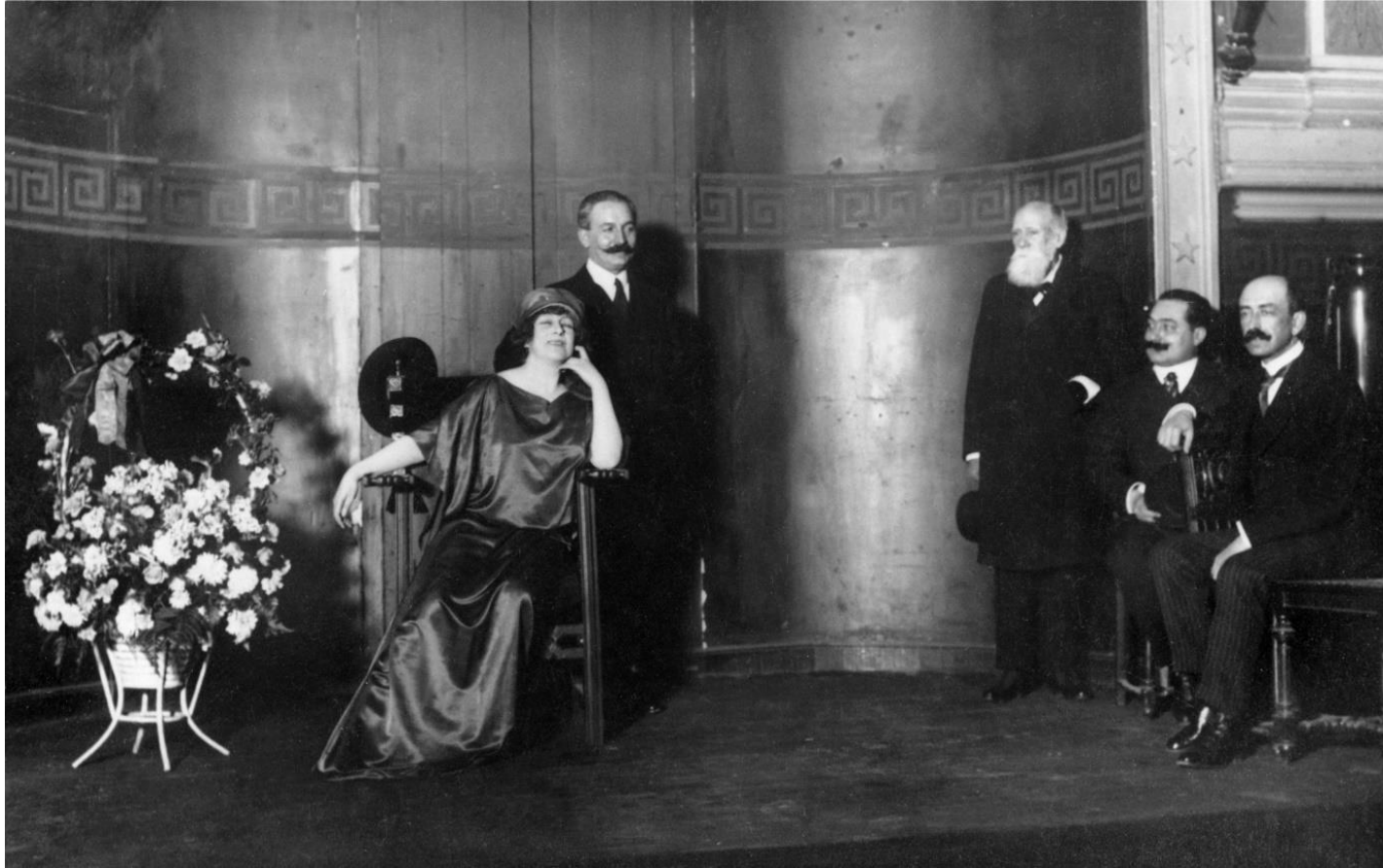
Miguel Salvador y Manuel de Falla (juntos a la derecha) y Georgette Leblanc Maeterlink con otras dos personas no identificadas, en el Ateneo de Madrid, durante el homenaje celebrado en honor de Falla y Turina, el 15 de enero de 1915.