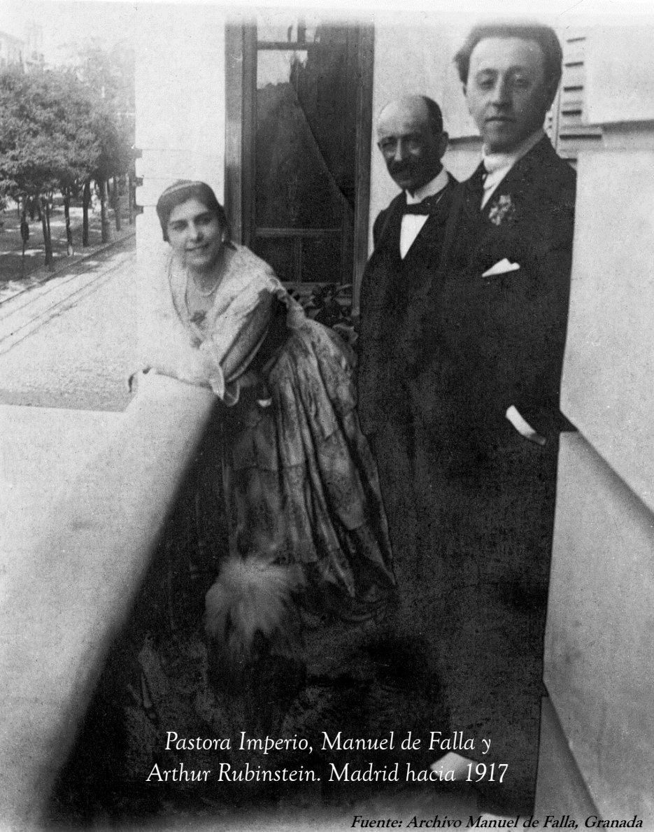
Pastora Imperio, Manuel de Falla y Arthur Rubinstein. Madrid hacia 1917