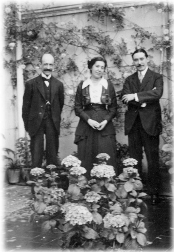
Manuel de Falla, María Lejárraga y Joaquín Turina Madrid 1916