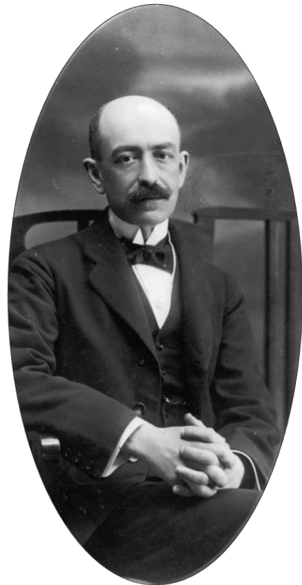
Manuel de Falla, 1915