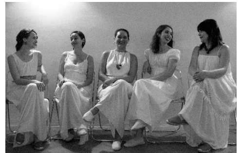
EGERIA, Medieval Voices

Hu: Códice de las Huelgas , LV: Llibre de Vermell de Monserrat ,