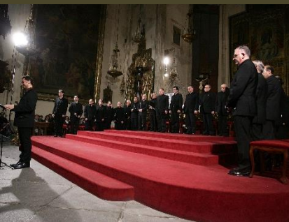
Schola Gregoriana de Madrid