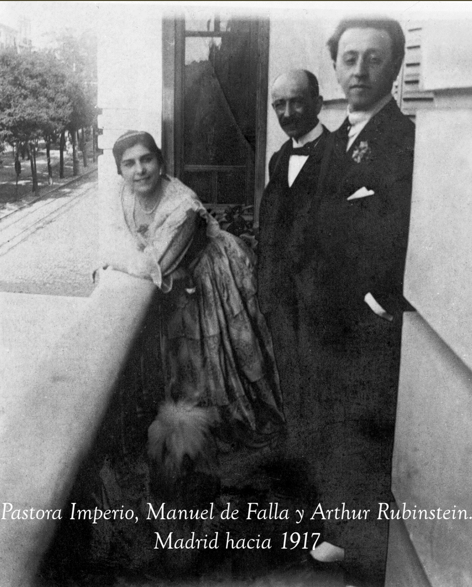
Pastora Imperio, Manuel de Falla y Arthur Rubinstein. Madrid hacia 1917