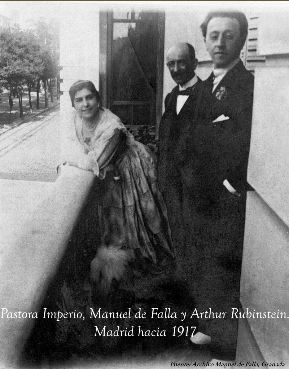
Pastora Imperio, Manuel de Falla y Arthur Rubinstein. Madrid hacia 1917