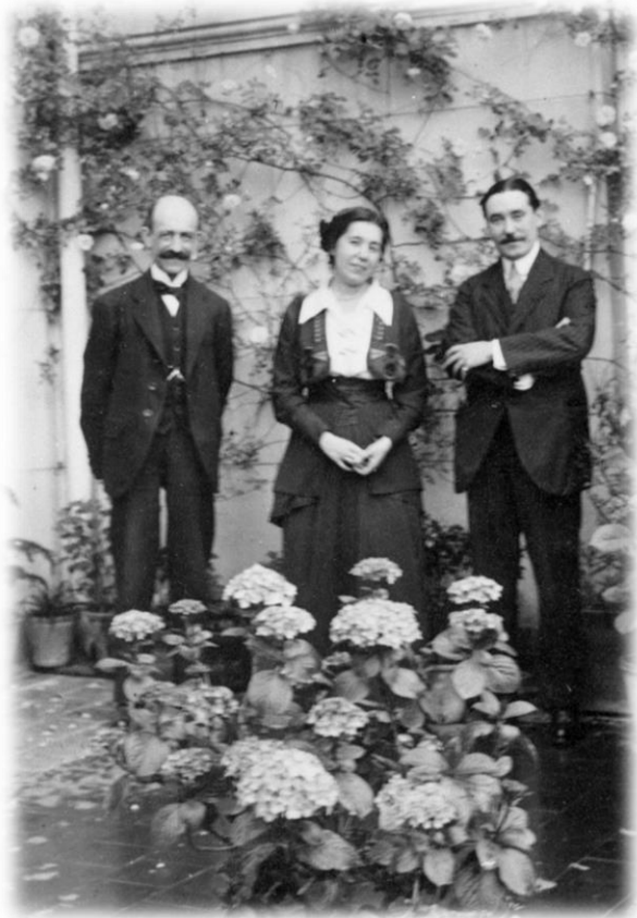
Manuel de Falla, María Lejárraga y Joaquín Turina Madrid 1916